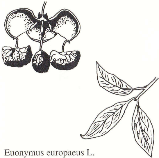
Euonymus europaeus L. Gemeines Pfaffenhütchen