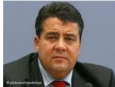
Der Bundesminister für Umwelt, Naturschutz und Reaktorsicherheit, Sigmar Gabriel