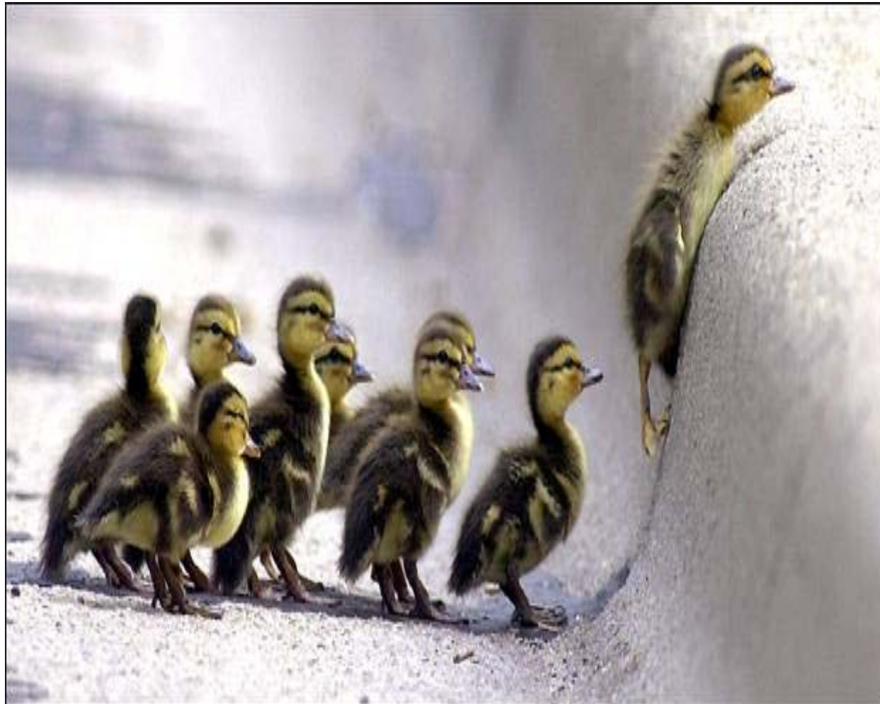
Jim Rider / South Bend Tribune